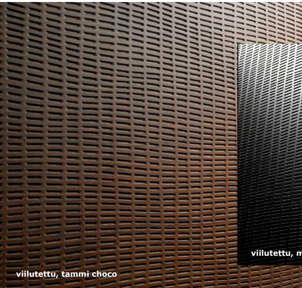
viilutettu, tammi choco