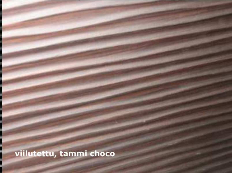
viilutettu, tammi choco